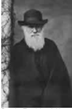
Darwin: Teorisi artık bir çok bilimsel delil ile çürütülmüştür.

Başta da belirttiğimiz gibi 19. yüzyılda zirveye tırmanan ateizmin en önemli dayanağı, Darwin'in evrim teorisidir. Darwinizm, insanın ve tüm diğer canlıların kökeninin bilinçsiz doğa mekanizmaları olduğunu ileri sürmekle, ateistlere asırlardır aradıkları bir fırsatı sağlamıştır. Nitekim Darwin'in teorisi hemen devrin en koyu ateistleri tarafından benimsenmiş, Marx ve Engels başta olmak üzere, ateist düşünürler bu teoriyi felsefelerinin temeli olarak belirlemişlerdir. O devirden bu yana da Darwinizm ile ateizm arasındaki ilişki değişmeden devam etmektedir.