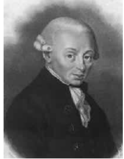
Immanuel Kant: Kainatın bir başlangıç ya da sonunun olmadığını savunmuştu ancak bu savında tamamen hatalıydı.

Materyalist evren anlayışını Yeni Çağ'da ilk kez savunan kişi ise (felsefi anlamda materyalist olmamasına rağmen) ünlü Alman düşünür Immanuel Kant oldu. Kant, evrenin sonsuzdan beri var olduğunu ve bu sonsuzluk içinde her olasılığın mümkün sayılması gerektiğini öne sürdü. 19. yüzyıla gelindiğinde ise, evrenin bir başlangıcı, yani yaratılış anı olmadığı şeklindeki iddia, geniş bir kabul görür hale gelmişti. Karl Marx, Friedrich Engels gibi diyalektik materyalistlerin şiddetle sahiplendikleri bu iddia, 20. yüzyıla da taşındı.