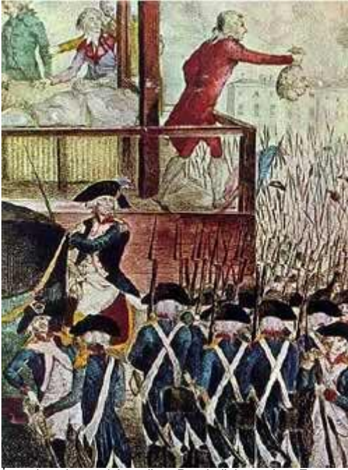
İnançlı ve barışçıl Amerikan Devrimi'nin tersine, Fransız Devrimi tamamen ateist, putperest ve oldukça vahşi idi.