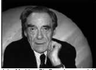
John Maddox: Big Bang konusundaki kehaneti tamamen geçersizdir.

İtiraflarda bulunmanın insan ruhuna iyi geldiğini söylerler. Ben de bir itirafta bulunacağım: Big Bang modeli, bir ateist açısından oldukça sıkıntı vericidir. Çünkü bilim, dini kaynaklar tarafından savunulan bir iddiayı ispat etmiştir: Evrenin bir başlangıcı olduğu iddiasını. Ben hala ateizme inanıyorum, ama bunu Big Bang karşısında savunmanın pek kolay ve rahat bir durum olmadığını itiraf etmeliyim. (4)