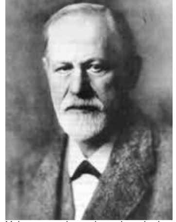
Yakın zamanda yapılan çalışmalarda Freud'un özellikle din konusundaki fikirlerinin hatalı olduğunu gösterdi.

19. yüzyılda gelişen ateist dogmanın psikoloji alanındaki temsilcisi, Avusturyalı psikiyatrist Sigmund Freud idi. Freud, ruhun varlığını reddeden, insanın tüm ruhsal dünyasını cinsel ve benzeri dünyevi dürtülerle açıklamaya çalışan bir psikoloji teorisi ortaya attı. Freud'un en büyük saldırısı ise dine karşıydı. 1927'de yayınlanan The Future of an Illusion (Bir İlüzyonun Geleceği) adlı kitabında, dini inancın sözde bir tür akıl hastalığı (nevroz) olduğunu ileri sürüyor ve insanlığın ilerlemesiyle birlikte dini inançların tamamen ortadan kalkacağı iddiasında bulunuyordu. Dönemin ilkel bilimsel koşulları altında, gerekli araştırma ve incelemeler yapılmadan, okuma ve kıyas imkanı olmadan ortaya atılan bu iddia son derece mantık dışıdır. Kuşkusuz Freud da bugün varsayımını tekrar değerlendirme imkanına sahip olsa, öne sürdüğü bu kit iddianın mantıksızlığına kendisi de şaşırarak ve böyle bir öngörünün saçmalığını ilk kendisi eleştirecektir. Freud'dan sonra da psikoloji bilimi ateist bir temelde gelişti. Sadece Freud değil, 20. yüzyılda gelişen diğer psikoloji ekollerinin kurucuları da koyu birer ateistti: davranışçı ekolün kurucusu B. F. Skinner ya da rasyonel-duygusal terapisinin kurucusu olan Albert Ellis gibi. Sonuçta psikoloji dünyası ateizmin alanı haline geldi. 1972 yılında Amerikan Psikoloji Derneği üyeleri arasında yapılan bir araştırma, ülkedeki psikologların sadece % 1.1'inin dini inanç sahibi olduğunu gösteriyordu. (14)