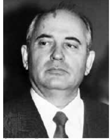
Gorbachev: Tüm çabalarına rağmen Sovyet toplumundaki "inançsızlık krizi"ni çözememiştir.

Sovyet sisteminin bu büyük "inançsızlık krizi"nin ilginç bir göstergesi, devlet başkanı Mihail Gorbaçov'un yapmaya çalıştığı reformlardır. Gorbaçov başa geldiği günden itibaren, ekonomik reformların yanında ahlaki sorunlarla da ilgilenmiş, örneğin ilk olarak alkolizme karşı bir kampanya başlatmıştır. Topluma moral verebilmek için uzun süre eski Marksist-Leninist terminolojiyi kullanmış, ancak bunun fayda etmediğini görünce, rejiminin son yıllarında bazı konuşmalarında Allah'tan söz etmeye dahi başlamıştır-gerçekte bir ateist olmasına rağmen. Ancak kuşkusuz bu samimiyetsiz inanç sözleri fayda etmemiş ve Sovyet toplumunun inanç krizi giderek daha da büyümüştür. Sonuç, dev Sovyet imparatorluğunun bir anda çökmesidir.