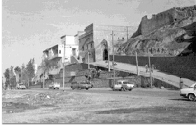
Kerkük şehri, Türkmenlerin en önemli yerleşim yeri olmasının yanısıra onların sembolü durumundadır. Resimlerde Kerkük'ten çeşitli görüntüler yer alıyor.

■ Ancak Türkiye, bu topraklarda yaşayan soydaşlarımızın ve elbette diğer tüm toplumların yaşadıkları acı ve sıkıntıları göz ardı edemez. Yaklaşık 90 yıldır yabancı devletler tarafından yok sayılan ve Irak yönetimleri tarafından da asimile edilmeye çalışılan Türkmen kardeşlerimizin güvenliğinin sağlanması, asırlar boyunca bölgede hakimiyet sürmüş bir İmparatorluğun varisi olan Türkiye'nin vicdani sorumluluğudur.