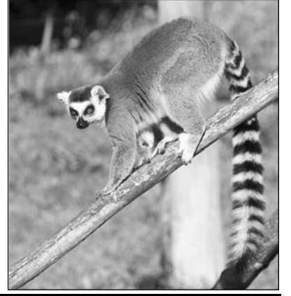
Lemurlar da Darwinistlerin bu yalanını şaşkınlıkla izliyorlar.

lerin Allah tarafından yaratıldığını savunan argümana destek sağlamıştır." (Mark Czarnecki, "The Revival of the Creationist Crusade", MacLean's, 19 Ocak 1981, s.56)