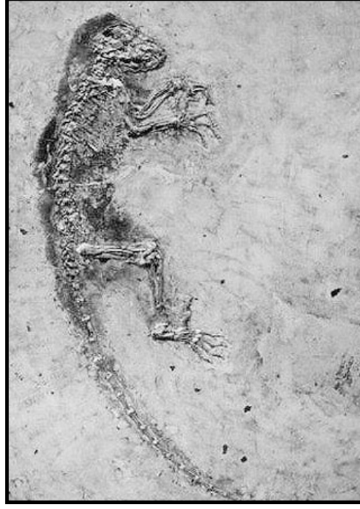
47 milyon yıl öncesine ait fosil İda (İda isimli üstteki resimdeki fosil) , soyu tükenmiş lemur türlerinden biridir. Hiçbir ara form özelliği taşımamaktadır, tam, mükemmel ve kusursuz bir canlıdır.