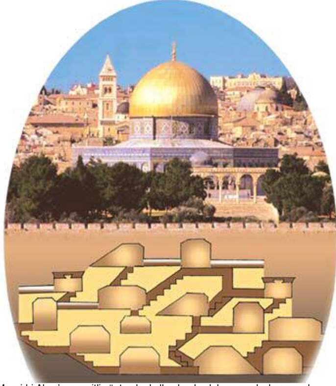
Mescid-i Aksa'nın çeşitli yöntemler kullanılarak yıkılmaya çalışılması ve bu doğrultuda yapılan kazı faaliyetleri birçok gazetede yer aldı.

Nitekim Kudüs'teki Harem-i Şerif bölgesinin altı kayalık bir yapıdadır. Peygamberimiz (sav)'in üzerine basarak miraca yükseldiği, sonradan üzerine Kubbet-üs Sahra'nın inşa edildiği kutsal kaya Hacer-i Muallak da burada bulunmaktadır. Hadiste bildirilen kayalık bölgenin, Kubbet-üs Sahra ve Mescid-i Aksa'nın bulunduğu Harem-i Şerif olması ve Deccal'in burada saklanması muhtemeldir.