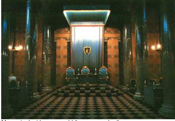
Mason toplantılarının yapıldığı mason mabedi.

Peygamberimiz (sav), Deccal'in gizlilik içinde hareket edeceğine işaret etmiştir: