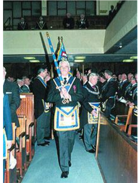
Masonik tören yürüyüşü

Peygamber Efendimiz (sav), başta Mesih Deccal'in fitnesi olmak üzere, tüm ahir zaman fitnelerinin Hz. İsa vesilesiyle yok edileceğini müjdelemiştir.