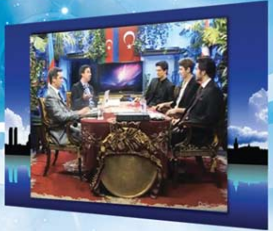
Ahir Zaman ve Yaratılış Gerçeği Programı

Röportajlardan Seçme Bölümler Belgeseller Belgesellerden Seçme Bölümler Röportajlarda Yayınlanan Kısa Filmler Dünyada Dine Dönüş Videoları Sevimli Canlılar