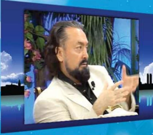
Adnan Oktar ile Sohbetler