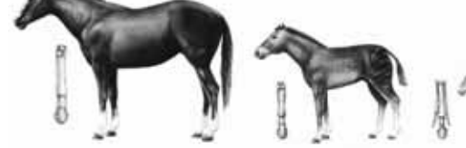
Evrimcilerin hayal ettiği gibi bir atın evrimi sıralaması yoktur...

Hipparion fosili gerçekte evrimcilerin bir zamanlar baş tacı ettikleri “hayali at serisi”nin bir üyesidir. 20. yüzyılın başında oluşturulan at serisi, bazı toynaklı fosillerinin arka ve ön ayaklarındaki tırnak sayılarına ve diş yapılarına göre dizildikleri bir şemaya dayanmaktadır. Amerikalı fosil araştırmacısı Othniel Charles Marsh ile biyolog Thomas Huxley'in geliştirdikleri bu şema, on yıllar boyunca müze ve ders kitaplarında sözde evrimin tartışılmaz kanıtıymış gibi sunulmuştur. Hipparion fosilinin günümüz at-