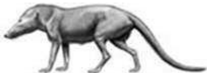
Le véritable Pakicetus