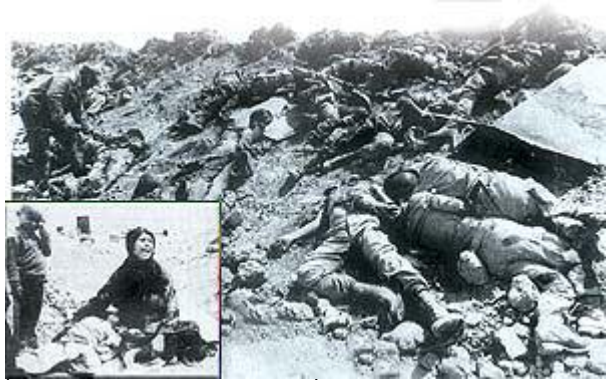
İki Müslüman ülke arasında yaşanan İran-İrak Savaşı'nda onbinlerce Müslüman hayatını kaybetti.

Bazı aydınlar, Batı'da gelişen din dışı felsefe ve ideolojilerin yanılgılarına kapılmış, bu fikirleri Müslüman topraklarına ihraç etmenin İslam dünyasını ileri götüreceğini sanmışlardır. Bu tarihi hatanın neden olduğu tahribatın izleri bugün de açıkça görülmektedir. Adaleti, fedakarlığı, merhameti, hoşgörü, açık fikirliliği, ileri görüşlülüğü getiren Kuran ahlakının yerine, 19. yüzyılda moda olan ama yanlışlıkları bugün ispatlanan bazı felsefe ve ideolojilerin topluma benimsetilmeye çalışılmasıyla birlikte, Müslüman dünyasında süregelen düzenin ve dayanışmanın yerini kargaşa ve parçalanmışlık almıştır. Bu kargaşayı sona erdirmek için bazı ülkelerde, yine Kuran ahlakına ters olan bir model ortaya çıkmış ve halkı acımasızca ezen despot rejimler kurulmuştur.