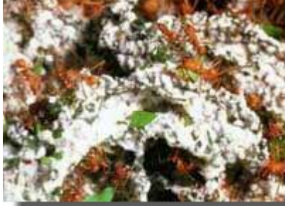
Attalarla mantarlar arasındaki ortak yaşam sayesinde, karıncalar beslenmede ihtiyaç duydukları proteini yaprakların üzerinde yetiştirdikleri mantar tomurcuklarından alırlar. Yukarıdaki resimde karıncaların yetiştirmiş olduğu mantar bahçesi görülmektedir.

Attalarla mantarlar arasındaki ortak yaşam sayesinde, karıncalar beslenmede ihtiyaç duydukları proteini yaprakların üzerinde yetiştirdikleri mantar tomurcuklarından alırlar. Yandaki resimde karıncaların yetiştirmiş olduğu mantar bahçesi görülmektedir.