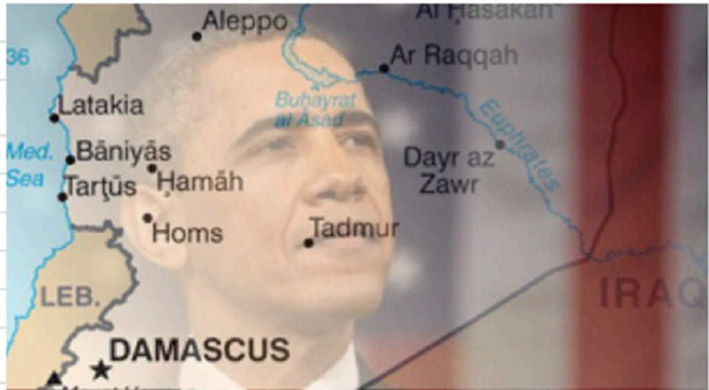
President Barack Obama and Syria