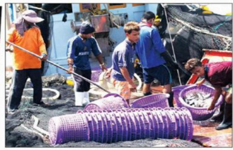
Migrant workers from Myanmar unload fish in the Gulf of Thailand in Sarab Sakhon Province, west of Bangkok. Some workers are forced on to Thai fishing boats by their families, others by unscrupulous employment brokers. Nearly half the workers make less than $100 a month in exchange for back-breaking labour. Some might not see any money at all.

Siz də köləliyin təxminən 150 il əvvəl ləğv edildiyini düşündən insanlardan biri ola bilərsiniz. Belə düşünməyinizin səbəbi, yəqin ki, öz istəyinizlə işlədiyiniz nizamlı bir işinizin olmasıdır.