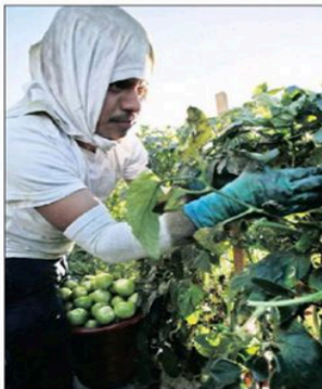
A farmworker at Lipman Produce picks a second harvest of tomato plants in Naples, Florida. Wal-Mart Stores joined an initiative that will require its Florida tomato suppliers to increase farmworker pay and protect workers from forced labour and sexual assault, among other things. America's largest retailer became the most influential corporation to join the initiative proposed by a coalition of farmworker activists based in south-west Florida.

YOU MAY be one of those who think slavery was abolished about 150 years ago. The reason you think that is that you probably have a job you chose to work at willingly. Forced labour was legally prohibited many years ago in most countries, especially in Europe. Likewise, slavery and forced labour are prohibited by Article 4 of the European Convention on Human Rights. But in many parts of the world, including Europe, people are still made to work like slaves despite these legal prohibitions. Forced labour is practised in many ways, several of which are beatings, threats, blackmail, confinement, detention, the confiscation of passports and to pay off debts. Modern slavery is not only a problem in underdeveloped countries. Modern slaves can be found in the very heart of Europe. This is not some well-known case, but a case that is not widely known. It is a case that is not widely known. It is a case that is not widely known.