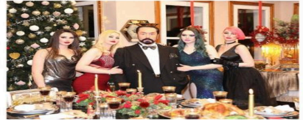
حاوره: محمد حكمون