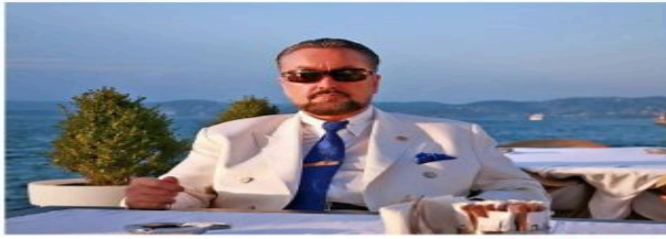
حاوره محمد حكيمون