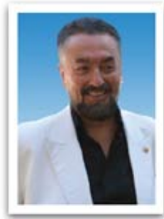
Adnan Oktar (Harun Yahya) Science & Technology

Il est connu pour sa position contre les concepts tels que le darwinisme et le matérialisme et il parle franchement de la nécessité d'appliquer ses idées à l'Ouest.