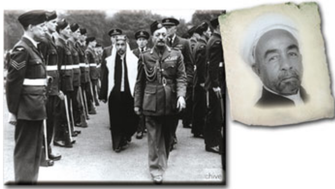
1951'de suikaste uğrayan Ürdün Kralı Abdullah.

Bilindiği gibi Ürdün, Haşimi Krallığı olarak anılmaktadır. Ürdün, Osmanlı'dan ayrıldıktan sonra bir dönem İngiltere'nin kontrolü altında idi. İngiltere 1946 Londra anlaşması gereğince Ürdün'ün bağımsızlığını tanıdı. Ve Ürdün emirliğinin başındaki Abdullah'a da Ürdün Krallığı payesi verildi. Kral Abdullah, daha sonra, 1951'de yine İngilizler tarafından öldürtüldü. Hadis'te dikkat çekilen olay da böylece gerçekleşmiş oldu.