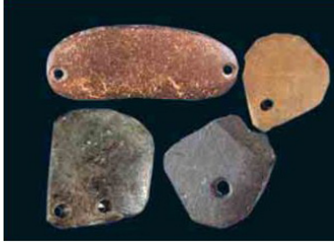
12 BİN YILLIK BONCUKLAR

Üstte MÖ 10 binli yıllarda kullanılmış olan kemikten yapılmış bu düğmeler, dönemin insanların kıyafet kültürlerinin olduğunu göstermektedir. Düğmeyi kullanan bir toplumun dikişi, kumaşı, dokumacılığı da bilmesi gerekir.