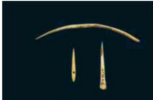
9-10 BİN YILLIK TIĞ VE İĞNELER

Üstte yaklaşık MÖ 10 bin yılına ait olan bu taşlar, arkeologların bulgularına göre bir tür boncuk olarak kullanılmaktaydı. Taşlardaki muntazam delikler dikkaç çekicidir. Bu delikler, taşla taşla vurularak açılmaz. Böyle sert taşlarda bu derece düzgün delikler açabilmek için çelik veya demirden yapılmış aletler kullanılmış olmalıdır.