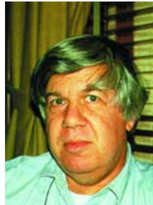
Stephen Jay Gould ve Darwin'in ırkçılığını anlattığı kitabı.