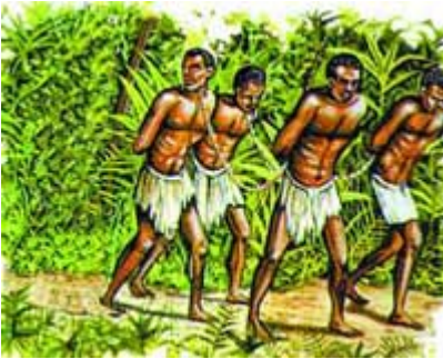
Köleleştirilen Afrikalı yerliler.

Darwin, "yaşam mücadelesi"nin insan ırkları arasında da geçerli olduğunu öne sürmüştü. (bkz. Yaşam mücadelesi ) "Kayırılmış ırklar" bu mücadelede üstün geliyorlardı. Darwin'e göre kayırılmış ırklar, Avrupalı beyazlardı. Asyalı ya da Afrikalı ırklar ise, yaşam mücadelesinde geri kalmışlardı. Darwin daha da ileri giderek, bu ırkların dünya üzerindeki "yaşam mücadelesi"ni yakın zamanda tamamen kaybederek yok olacaklarını ileri sürmüştü: