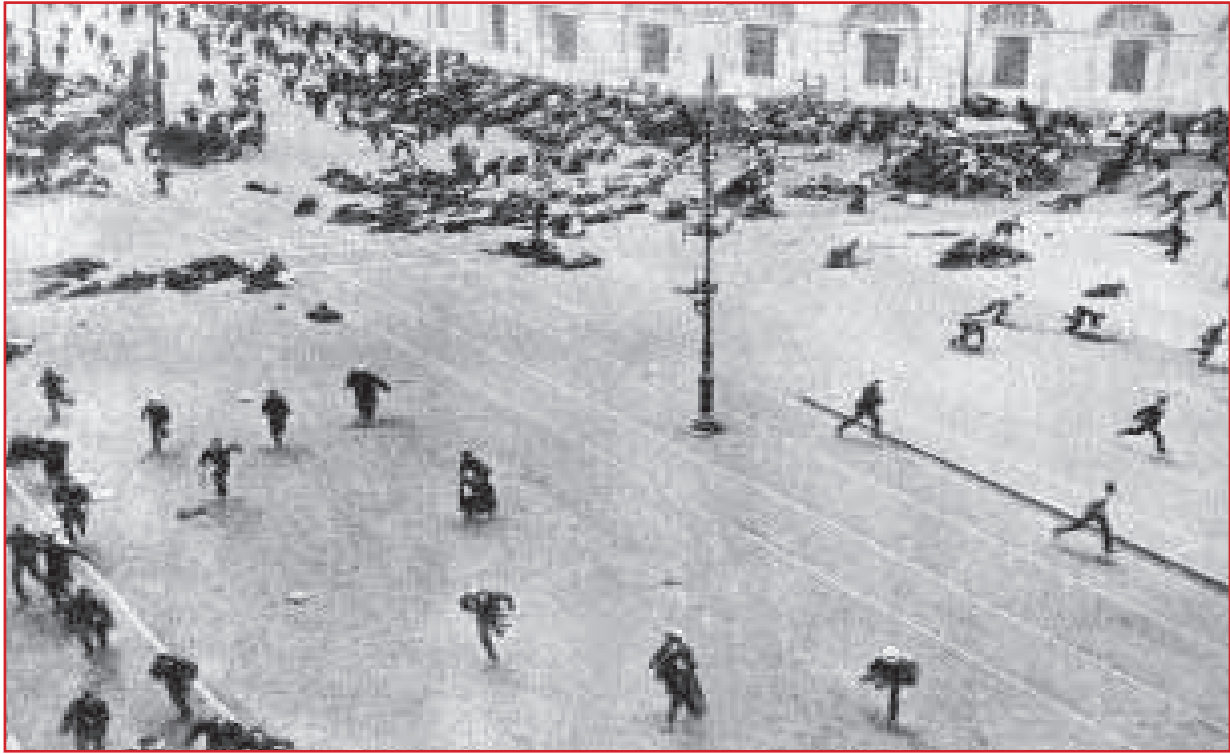
Bolşevik inqilabında Rusiya