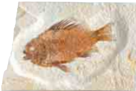
POISSON-LUNE 54 à 37 millions d'années