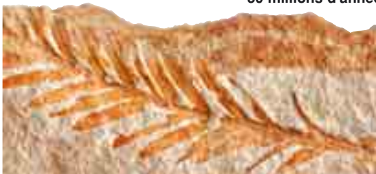
METASEQUOIA 50 millions d'années