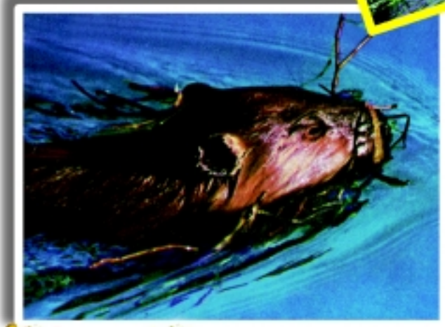
ബീവറുകൾ വീടു നിർമ്മാണത്തിലേർപ്പെടുമ്പോൾ ആദ്യമാദ്യം തിടുകിൽ ചെറുശാഖകൾ കൊണ്ടുവരുന്നു. ബീവറുകൾക്ക് ദൈവം നൽകിയ നൈപുണ്യവും ബുദ്ധിശക്തിയും മികച്ചതുതന്നെ!