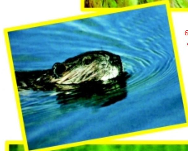
ഓരോ ജീവിയെ കുറിച്ചും വായിക്കുമ്പോഴും ക്രാബിന്റെ ദൈവത്തിന്റെ മികച്ച സൃഷ്ടികളാണവയെന്ന കാര്യം ഓർക്കണം.