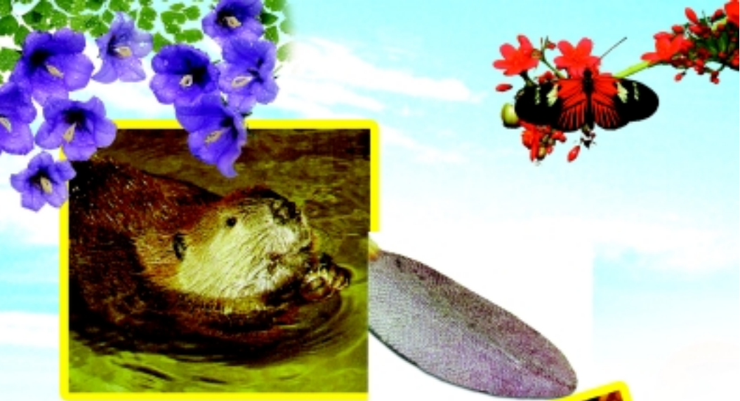
ഫലിപ്പറുക്കളായി പ്രവർത്തിക്കുന്ന വാൽ (മുകളിൽ), പാദങ്ങൾ, പല്ലുകൾ എന്നിവ മാത്രമല്ല; ബീവറുകളുടെ ശരീരത്തിലെ ഓരോ അവയവവും ദൈവം അവയ്ക്കു കനിഞ്ഞരുളിയവയാണ്. അവയില്ലാ യിരുന്നൂബെങ്കിൽ ബീവറുകളുടെ നിലനിൽപ്പുതന്നെ അപകടത്തിലാവും?