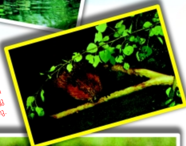
വീടുനിർമ്മാണത്തിന് ബീവറുകൾ ചളിയും ഉപയോഗിക്കുന്നു. ചളിയുപയോഗിച്ച് അവ ശാഖകളും തടികളും തമ്മിൽ ഒട്ടിച്ചു നിർത്തുന്നു.