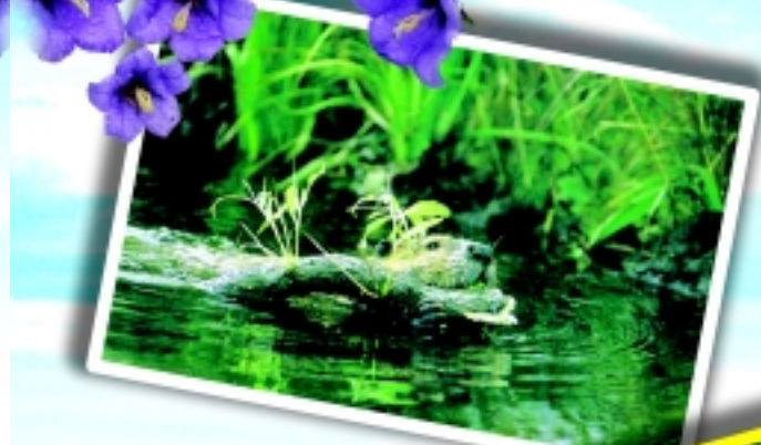
കുറിനാധ്യാനികളായ ബീവറുകൾ പിന്നീട് ഭാരമുള്ള മരക്കഷണങ്ങൾ കൊണ്ടുവരുന്നു.