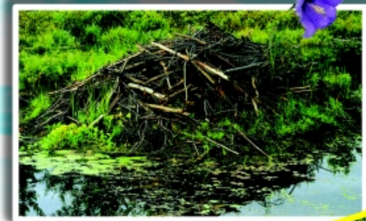
കൂട്ടിയിട്ട ഈ ശാഖകൾ താമസിയാതെ ബീവറു കളുടെ വീടായി രൂപം പ്രാപിക്കും.