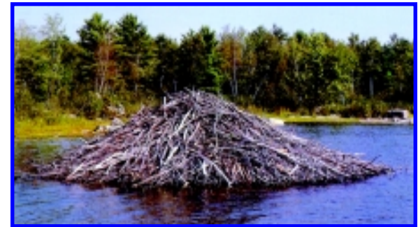
മരത്തടികൾ നീക്കുന്നതിനെ കുറിച്ചു അവതമ്മിൽ ഒട്ടിച്ചുവെക്കുന്നതിനെക്കുറിച്ചും ബീവറുകൾ വിശദീകരിക്കുന്നു.

ബീവറമ്മാവൻ: തുരങ്കം എത്തിച്ചേരുന്നത് ഉള്ളിലുള്ള ഒരു