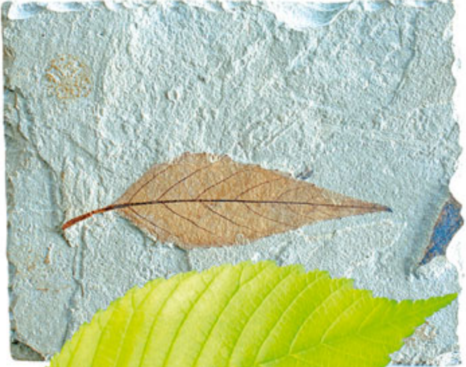
Çitlembik Yaprağı Dönem: Senozoik zaman, Eosen dönemi Yaş: 45 milyon yıl Bölge: Green River Oluşumu, Wyoming, ABD

Orta büyüklükte bir ağaç olan çitlembikler ortalama 10-25 metre uzunluğundadırlar. Bulunan tüm çitlembik fosilleri, bu bitkinin günümüzdeki örnekleriyle bundan on milyonlarca yıl önce yaşamış örneklerinin tamamen birbirinin aynı olduğunu ortaya koymaktadır. Bu aynılık, evrim iddiasını yerle bir etmektedir.