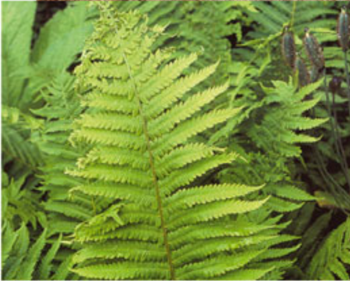
Eęrelti Otu Dnem: Paleozoik zaman, Karbonifer dnemi Yař: 300 milyon yıl Blge: İngiltere