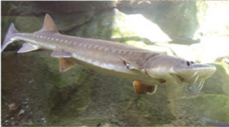
Mersin Balığı Dönem: Mezozoik zaman, Kretase dönemi Yaş: 144 - 65 milyon yıl Bölge: Çin