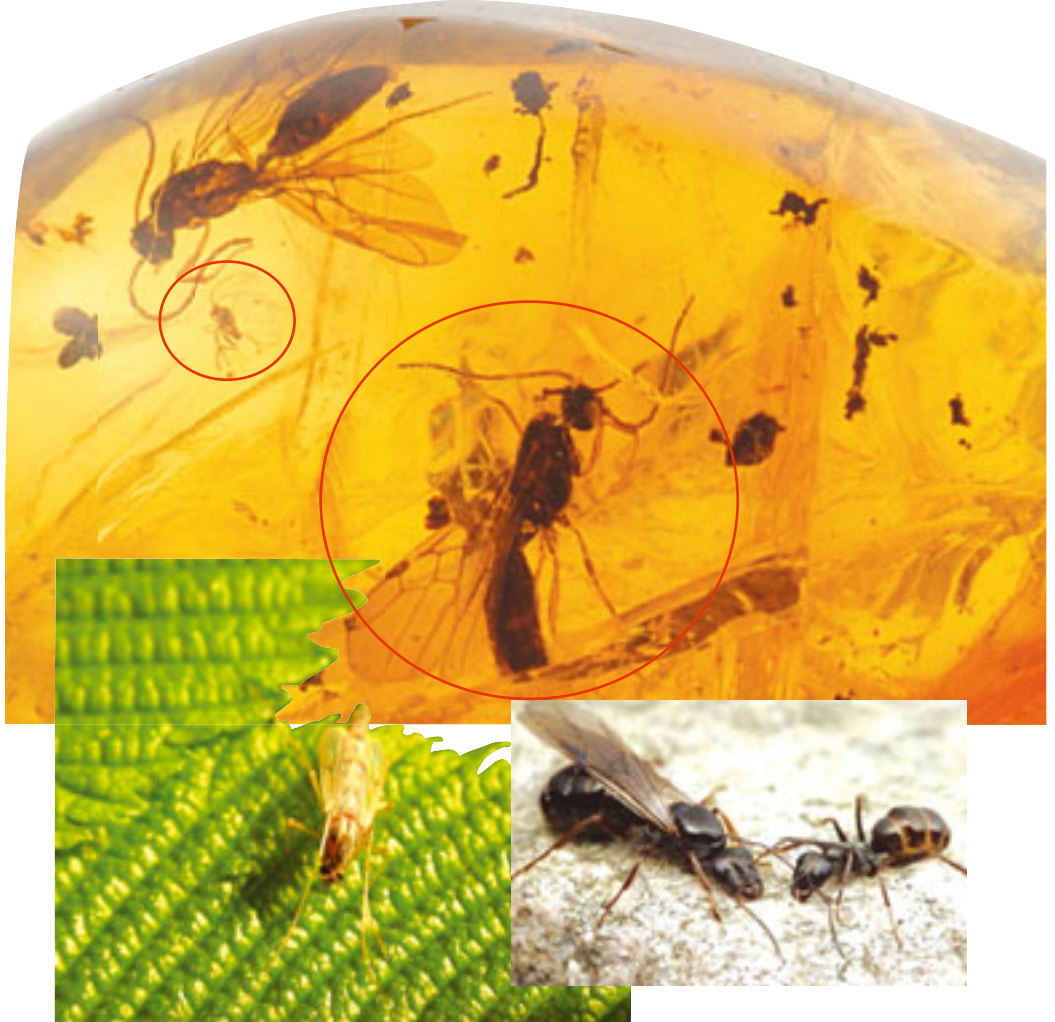
25 milyon yıllık tatarcık ve kanatlı karınca fosili