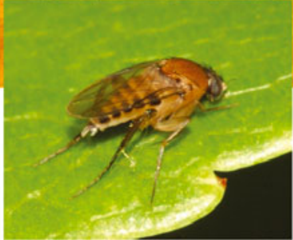
Kambur Sinek Dönem: Senozoik zaman, Eosen dönemi Yaş: 45 milyon yıl Bölge: Rusya