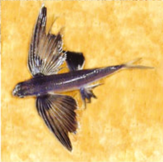
Uçan Balık Dönem: Meozoik zaman, Kretase dönemi Yaş: 95 milyon yıl Bölge: Lübnan