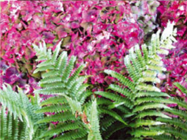
Eğrelti Otu Dönem: Paleozoik zaman, Karbonifer dönemi Yaş: 300 milyon yıl Bölge: İngiltere