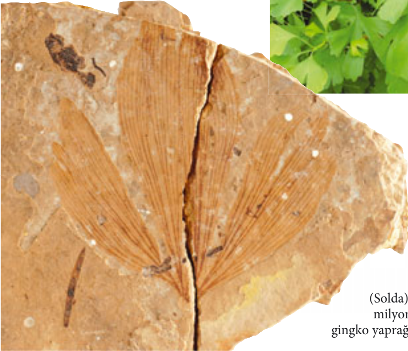
(Solda) 54-37 milyon yıllık ginkgo yaprağı fosili