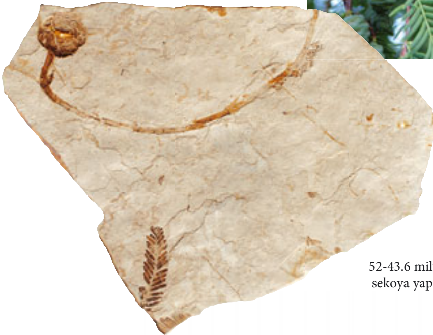
52-43.6 milyon yıllık sekoya yaprağı fosili