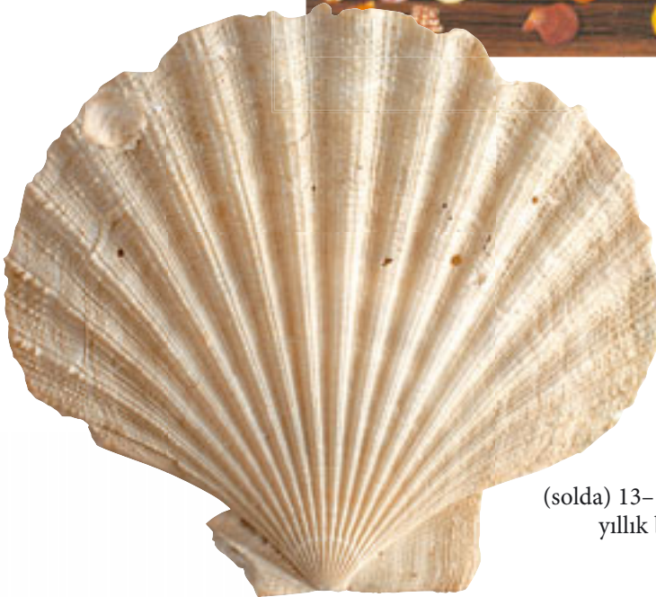
(solda) 13– 12.5 milyon yıllık bivalve fosili