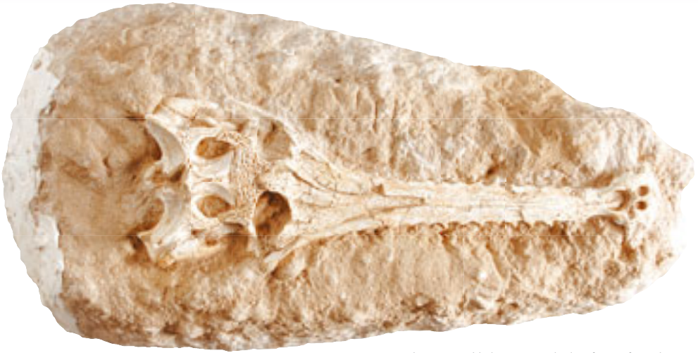
54-37 milyon yıllık timsah kafası fosili