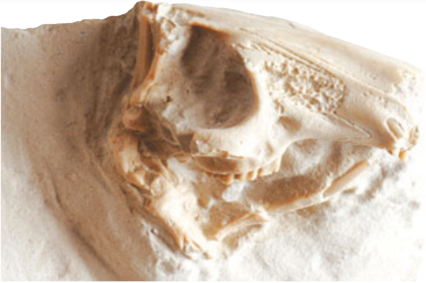
33 milyon yıllık tavşan kafatası fosili