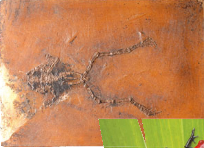
(Yukarıda) 50 milyon yıllık kurbağa fosili.

Bu kurbağa cinsinin bir kısmı arka ayaklarıyla toprağı kazarak toprak içerisinde, bir kısmı da sulu ortamlarda yaşar. Darwinistler amfibiye'nin sözde atasının balıklar olduğunu iddia ederler. Ancak bu iddialarını delillendirebilecek hiçbir bulguları yoktur. Tam tersine bilimsel bulgular, iki tür arasında çok büyük anatomik farklılıklar olduğunu ve birinin diğ'erinden türemiş olmasının imkansız olduğunu göstermektedir. Bu bilimsel bulgulardan biri de fosil kayıtlarıdır.