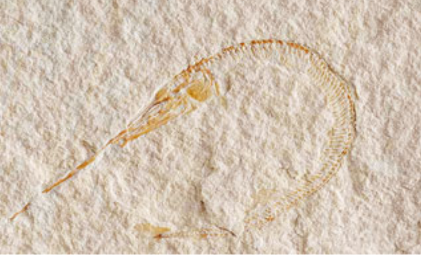
Üstte Lübnan'da bulunmuş 95 milyon yıllık zargana balığı fosili.