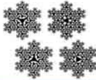
Sadece üçgen kullanarak fraktal geometriye uygun oluşturulmuş birçok kar tanesi örneği