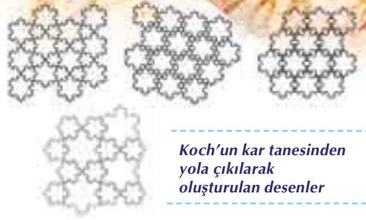
Koch'un kar tanesinden yola çıkılarak oluşturulan desenler

Koch'un kar taneleri bu bilim adamının önce matematik ve fraktal geometri kurallarını öğrenmesi, ardından da bu bilgilerini kağıt üzerine aktarması ile ortaya çıkmıştır. Diğer bir ifadeyle, kar tanelerini uzun süreli bir eğitimin sonucunda çizmiştir. Doğadaki canlı ve cansız varlıkların yaratılışı göz önüne alındığında ise,